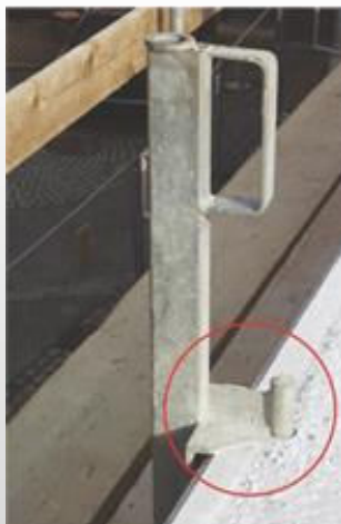
Standort Ens Dorf

Mathias-Erzberger-Straße 9-11 66806 Ens Dorf Tel.: +49 (0) 6831 / 95 67 - 15